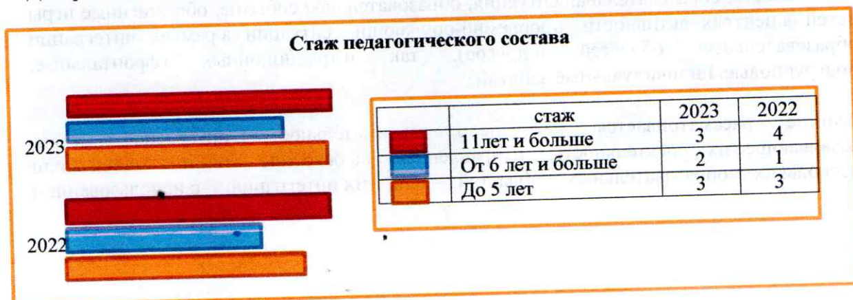
Диаграмма с характеристиками кадрового состава МКДОУ «Цветковский детский сад»

Курсы повышения квалификации в 2023 году прошли 10 работников МКДОУ «Цветковский детский сад», из них 8 педагогов. На 30.12.2023 2 педагога проходят обучение в ВУЗах по педагогическим специальностям.